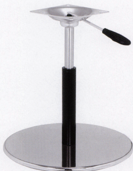
G-14 \left\{ \begin{array}{l} \text{H425mm} \\ \text{L340mm} \end{array} \right.