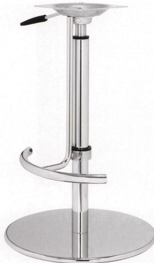
G-111-STP [ H740mm L615mm